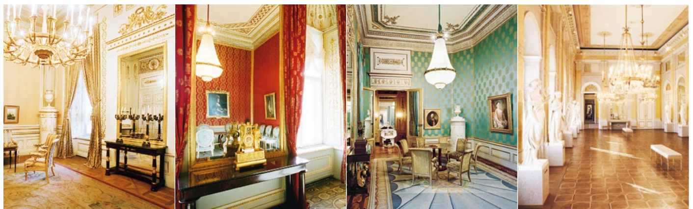
Ložnice arcivévody Karla

Ložnice arcivévody Karla; nábytek: trvalá zápůjčka MAK – Rakouského muzea užitého umění / současného umění | Čajový salónek; | Písárna; nábytek: trvalá zápůjčka MAK – Rakouského muzea užitého umění / současného umění | Sál Múz