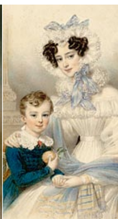
Princezna Henrietta Nasavsko-Weilburská