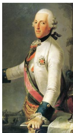
Vévoda Albert Sasko-těšínský

Anonym, Albert Sasko-Těšínský, 1777; © Albertina, Vídeň | Alexandre Roslin, Arcivévodkyně Marie Christina, 1778; © Albertina, Vídeň; trvalá zápůjčka Rakouské státní knihovny Vídeň | Georg Decker (podle Antona Einsleho), Arcivévoda Karel Rakouský, po roce 1847; © Albertina, Vídeň | Johann Nepomuk Ender, Princezna Henrietta Nassavsko-Weilburská se svým nejstarším synem arcivévodou Albrechtem, bez datace; © Albertina, Vídeň | Georg Decker, Arcivévoda Albrecht; bez datace; © Albertina, Vídeň | Anonym, Arcivévoda Bedřich; bez datace; © Albertina, Vídeň