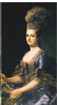
Arcivévodkyně Marie Christina