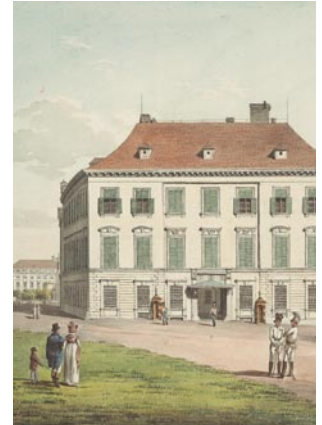
Palác sasko-těšínského vévody Alberta, 1816

Vídeňská Albertina patří k nejvýznamnějším sbírkám na světě. Od roku 1805 sídlí v jednom z nejnádhernejších klasicistních paláců v Evropě. Její název pochází od sasko-těšínského vévody Alberta, zakladatele sbírky a zetě Marie Terezie. Vévoda Albert nechal v letech 1802 až 1804 rozšířit barokní městský palác hraběte Silva-Taroucy vybudováním impozantního křídla se slavnostními prostory, jež postavil belgický architekt Louis de Montoyer. Vzácné vybavení ve stylu Ludvíka XVI. bylo dodáno francouzskými královskými dílnami v Paříži a Versailles. V roce 1822 dal adoptivní syn a dědic vévody Alberta, arcivévoda Karel, podnět k rekonstrukci nynějších habsburských reprezentačních prostor ve stylu francouzského empíru a pověřil Josepha Danhausera, aby palác vybavil ušlechtilým nábytkem a uměleckými parketovými podlahami. Aristokratický historický vzhled palácových průčelí z roku 1867 pochází od Karlova nejstaršího syna, arcivévody Albrechta. V letech 1895 a 1897, v poslední fázi zařizování paláce, vzniklo za Albrechtova synovce a adoptivního syna, arcivévody Bedřicha, takzvané „španělské apartmá“, jediná stálá rezidence španělské královské rodiny mimo vlastní zemi.