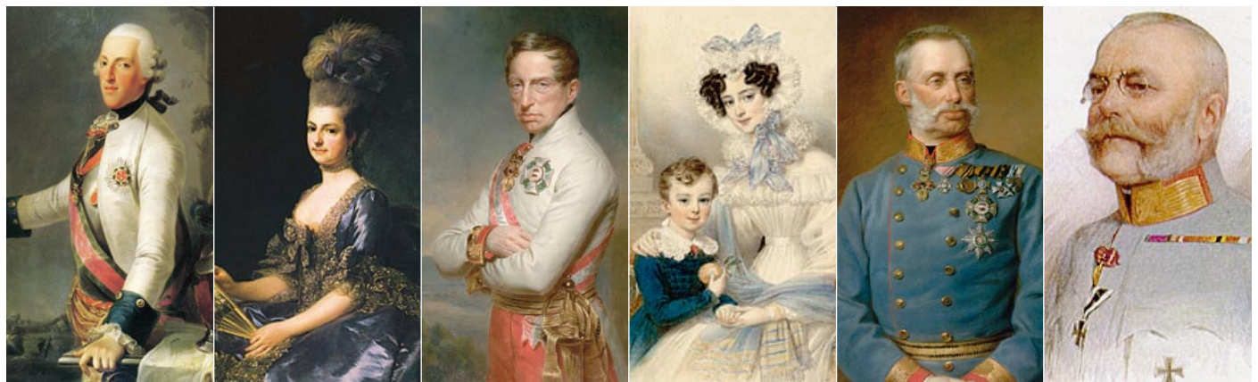
阿尔伯特·冯·萨克森-特生公爵

阿尔伯特·冯·萨克森-特生肖像画，1777年无名氏的作品；© 版权归维也纳阿尔贝蒂娜博物馆所有 | 玛丽·克里斯蒂娜大公肖像画，亚历山大·洛斯科林1778年的作品；© 版权归维也纳阿尔贝蒂娜博物馆所有；由奥地利维也纳国家图书馆长期出借 | 卡尔·冯·奥地利大公肖像画，1847年后乔治·戴克临摹安童·安斯勒的作品；© 版权归维也纳阿尔贝蒂娜博物馆所有 | 亨莉特·冯·拿骚-魏尔堡公主及其长子阿尔布莱希特大公的肖像画，约翰·内波穆科·安得尔的作品，作品绘制年代不详；© 版权归维也纳阿尔贝蒂娜博物馆所有 | 阿尔布莱希特大公肖像画，乔治·戴克的作品，作品绘制年代不详；© 版权归维也纳阿尔贝蒂娜博物馆所有 | 弗里德里希大公肖像画，无名氏作品，作品绘制年代不详；© 版权归维也纳阿尔贝蒂娜博物馆所有；