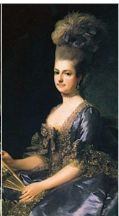
Erzherzogin Marie Christine