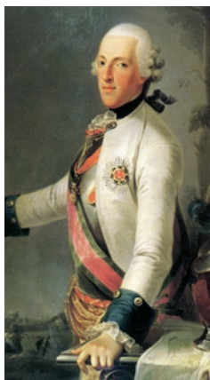
Herzog Albert von Sachsen-Teschen

Anonym, Albert von Sachsen-Teschen, 1777; © Albertina, Wien | Alexandre Roslin, Erzherzogin Marie Christine, 1778; © Albertina, Wien | Dauerleihgabe der Österreichischen Nationalbibliothek Wien | Georg Decker (nach Anton Einsle), Erzherzog Carl von Österreich, nach 1847; © Albertina, Wien | Johann Nepomuk Ender, Prinzessin Henriette von Nassau-Weilburg mit ihrem ältesten Sohn Erzherzog Albrecht, o.J.; © Albertina, Wien | Georg Decker, Erzherzog Albrecht; o.J.; © Albertina, Wien | Anonym, Erzherzog Friedrich, o.J.; © Albertina, Wien