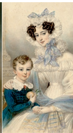
Prinzessin Henriette von Nassau-Weilburg