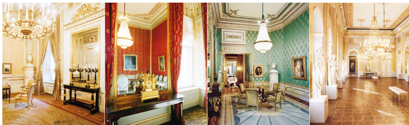
La Chambre à coucher de l'archiduc Charles

Chambre à coucher de l'archiduc Charles; © Albertina, Vienne / Photographie: AnnA BlAU; meubles: prêts permanents du MAK – le Musée autrichien des Arts appliqués / de l'Art contemporain | Salon de thé; © Albertina, Vienne / Photographie: Andreas Hofer | Bureau; © Albertina, Vienne / Photographie: Rupert Steiner; meubles: prêts permanents du MAK – le Musée autrichien des Arts appliqués / de l'Art contemporain | Salle des muses; © Albertina, Vienne / Photographie: Andreas Hofer