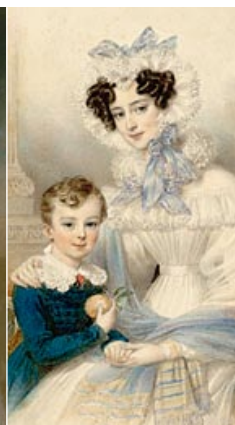
La princesse Henriette de Nassau-Weilburg