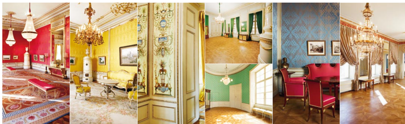
La Salle des audiences

Salle des audiences: © Albertina, Vienne / Photographie: Andreas Hofer | Salle rococo: © Albertina, Vienne / Photographie: Andreas Hofer | Cabinet Wedgwood: © Albertina, Vienne / Photographie: Andreas Hofer | Chambre mortuaire de l'archiduc Charles: © Albertina, Vienne / Photographie: AnnA BlaU | Cabinet ovale: © Albertina, Vienne / Photographie: AnnA BlaU; meubles: prêts permanents du MAK – le Musée autrichien des Arts appliqués / de l'Art contemporain | Petite suite espagnole: © Albertina, Vienne / Photographie: elwoods.at; meubles: prêts permanents du MAK – le Musée autrichien des Arts appliqués / de l'Art contemporain | Grande suite espagnole: © Albertina, Vienne / Photographie: Andreas Hofer