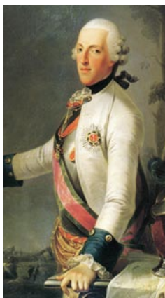
Le duc Albert de Saxe-Teschen

Anonyme, Albert de Saxe-Teschen, 1777 ; | Alexandre Roslin, Duchesse Marie-Christine, 1778 ; | Georg Decker (d'après Anton Einsle), Archiduc Charles d'Autriche, après 1847 ; | Johann Nepomuk Ender, Princesse Henriette de Nassau-Weilburg et son fils aîné l'archiduc Albrecht, s. a. | Georg Decker, Archiduc Albrecht; s. a. | Anonyme, Archiduc Frédéric, s. a.