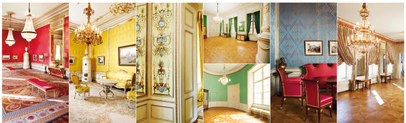
Camera delle udienze

Camera delle udienze: © Albertina, Vienna; Foto: Andreas Hofer | Camera rococò: © Albertina, Vienna; Foto: Andreas Hofer | Gabinetto di Wedgwood: © Albertina, Vienna; Foto: Andreas Hofer | Camera mortuaria Arciduca Carlo: © Albertina, Vienna; Foto: AnnA BlaU | Gabinetto ovale: © Albertina, Vienna; Foto: AnnA BlaU; Mobili: in prestito permanente dal museo austriaco di arte applicata e arte contemporanea (MAK) | Piccolo appartamento spagnolo: © Albertina, Vienna; Foto: elwoods.at; Mobili: in prestito permanente dal museo austriaco di arte applicata e arte contemporanea (MAK) | Grande appartamento spagnolo: © Albertina, Vienna; Foto Andreas Hofer