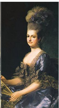
Arciduchessa Maria Cristina