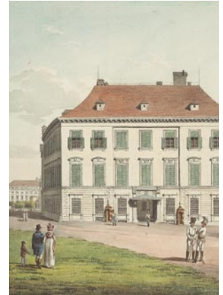
Jakob Alt, il palazzo del Duca Alberto di Sassonia-Teschen, 1816

L'Albertina in Vienna è considerata una delle più importanti collezioni del mondo. Dal 1805 è custodita presso uno dei palazzi neoclassici più sontuosi d'Europa. Il suo nome risale al Duca Alberto di Sassonia-Teschen, fondatore della collezione e genero di Maria Teresa. Il Duca Alberto fece ampliare il palazzo barocco del Conte Silva-Tarouca tra il 1802 ed il 1804 attraverso la costruzione di un'impressionante ala, per opera dell'architetto belga Louis de Montoyer. I raffinatissimi arredi nello stile di Louis Seize derivano dalle officine di corte francesi di Parigi e Versailles. Nel 1822, l'Arciduca Carlo, figlio adottivo ed erede del Duca Alberto, ordinò la ristrutturazione delle sale di rappresentanza asburgiche nello stile dell'impero francese ed incaricò Joseph Danhauser di arredare il palazzo con i preziosi mobili e gli elaborati pavimenti in parquet. L'imponente, storica immagine delle facciate del palazzo del 1867 va attribuita all'Arciduca Albrecht, figlio maggiore di Carlo. Tra il 1895 ed il 1897, durante l'ultima fase di rinnovamento del palazzo, nacque sotto il nipote e figlio adottivo di Albrecht, l'Arciduca Federico, il cosiddetto "appartamento spagnolo", l'unica residenza permanente della famiglia reale spagnola all'infuori dei propri confini territoriali.