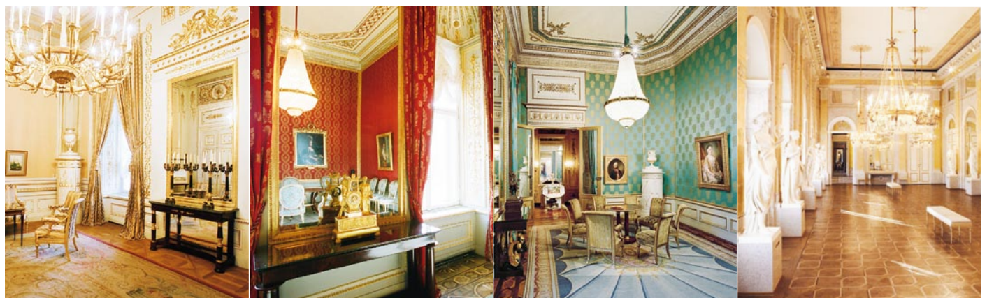
La camera da letto dell'Arciduca Carlo

Camera da letto Arciduca Carlo; © Albertina, Vienna; Foto: AnnA BlAU; Mobili: in prestito permanente dal museo austriaco di arte applicata e arte contemporanea (MAK) | Salone da tè; © Albertina, Vienna; Foto: Andreas Hofer | Studio; © Albertina, Vienna; Foto: Rupert Steiner; Mobili: in prestito permanente dal museo austriaco di arte applicata e arte contemporanea (MAK) | Sala delle muse; © Albertina, Vienna; Foto: Andreas Hofer