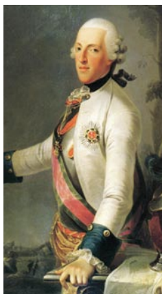
Duca Alberto di Sassonia-Teschen

Anonimo, Alberto di Sassonia-Teschen, 1777; © Albertina, Vienna | Alexandre Roslin, Arciduchessa Maria Cristina, 1778; © Albertina, Vienna; in prestito permanente dalla Biblioteca Nazionale Austriaca, Vienna | Georg Decker (secondo Anton Einsle), Arciduca Carlo d'Austria, dopo il 1847; © Albertina, Vienna | Johann Nepomuk Ender, Principessa Enrichetta di Nassau-Weilburg con suo figlio maggiore, l'Arciduca Albrecht, o.j.; © Albertina, Vienna | Georg Decker, Arciduca Alberto; o.j.; © Albertina, Vienna | Anonimo, Arciduca Federico, o.j.; © Albertina, Vienna