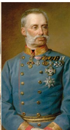
アルブレヒト大公