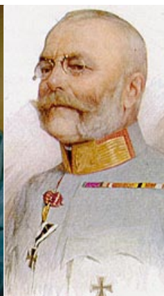
フリードリヒ大公