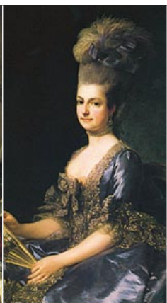
マリー・クリスティーネ大公