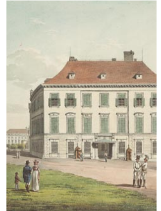
ヤーコブ・アルト、アルベルト・フォン・ザクセン＝テッセン公爵の宮殿、1816年 ©ウィーン、アルベルティーナ

ウィーンのアルベルティーナは世界で最も重要な美術コレクションの一つで、1805年以來ヨーロッパで最も絢爛豪華な宮殿の一つであるこの古典主義建築の中に保管されています。アルベルティーナという名前は、このコレクションの創始者アルベルト・フォン・ザクセン＝テッセン公爵に由来します。マリア・テレジア女帝の娘婿だった同公爵はベルギーの建築家ルイ・ド・モントイエールを起用し、ジルヴァ・タロウカ男爵の所有であったバロック様式の街宮殿に豪華な部屋がいくつもある建物の翼部分を1802年から1804年にかけて増築させました。選び抜いたルイ十六世風の内装品は、パリとベルサイユのフランス王立工房から取り寄せたものです。1822年にはアルベルト公爵の養嫡子カール大公が今やハプスブルクの所有となったこの豪華な広間をフランス帝国風の様式に改築させ、ヨーゼフ・ダンハウザーに気品ある家具や技巧を凝らした床板細工を作らせました。1867年にできた堂々たる歴史主義建築の宮殿正面は、カール大公の長男アルブレヒト大公が作らせたものです。1895年から1897年の間には宮殿の最後の増築が行われ、アルブレヒト大公の甥で養子のフリードリヒ大公の下でいわゆる「スペインのアパルトマン」が作られました。これはスペイン王室が領土外に持つ唯一の別荘です。