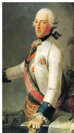
Książę Albert Sasko-Cieszyński