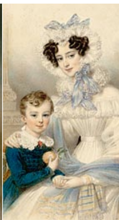
Księżniczka Henrietta von Nassau-Weilburg