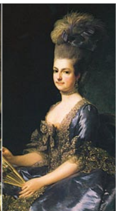
Arcyksiężna Maria Krystyna