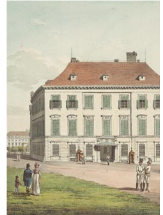
Jakob Alt, Pałac księcia Alberta Sasko-Cieszyńskiego, 1816

Albertina w Wiedniu zalicza się do najbardziej znaczących kolekcji dzieł sztuki na świecie. Od roku 1805 mieści się ona w jednym z najbardziej okazałych klasycystycznych pałaców Europy. Jej nazwa wywodzi się od księcia Alberta Sasko-Cieszyńskiego, założyciela tej kolekcji i zięcia Marii Teresy. Pomiędzy rokiem 1802 a 1804 książę Albert kazał rozbudować barokowy miejski pałac hrabiego Silva-Tarouca o imponujące skrzydło komnat przepychu, wzniesione przez belgijskiego architekta Louisa de Montoyer. Wytworne wyposażenie w stylu Louis-seize (Ludwika XVI) przybyło z francuskich królewskich warsztatów dworskich z Paryża i Wersalu. W roku 1822 arcyksiążę Karol, adoptowany syn i spadkobierca księcia Alberta, polecił na nowo zaprojektować te odtąd habsburskie komnaty przepychu w stylu francuskiego empire i zlecił Josephowi Danhauserowi wyposażenie pałacu w szlachetne meble i kunsztowne parkiety. Wielkopański historyczny wygląd elewacji pałacu z roku 1867 wywodzi się od arcyksięcia Albrechta, najstarszego syna Karola. Pomiędzy rokiem 1895 a 1897, w ostatniej fazie wyposażania pałacu, za panowania bratanka Albrechta i adoptowanego syna arcyksięcia Fryderyka, powstał tak zwany „Apartament hiszpański“, jedyna stała rezydencja hiszpańskiej rodziny królewskiej poza jej własnym krajem.