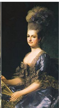
Arhiducesa Maria Cristina