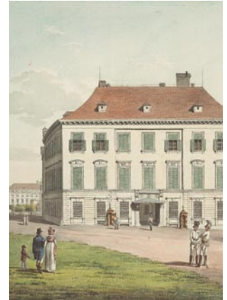
Jakob Alt, Palatul ducelui Albert de Saxa-Teschen, 1816. Viena, Albertina

Albertina din Viena se numără printre cele mai importante colecții ale lumii. Din 1805 este găzduită de unul din cele mai somptuoase palate clasiciste ale Europei. Numele și-l datorează ducelui Albert de Saxa-Teschen, fondatorul colecției și ginere al Mariei Thereza. Între 1802 și 1804 ducele Albert a lărgit palatul baroc al contelui Silva-Tarouca, adăugându-i o aripă impozantă cu săli de onoare, construită de arhitectul belgian Louis de Montoyer. Alesul decor în stil Ludovic al XVI-lea a fost adus din atelierile regale franceze ale Curții de la Paris și Versailles. În 1922 arhiducele Carl, fiul adoptiv și moștenitorul ducelui Albert, a dispus redecorarea sălilor de onoare 1822 acum habsburgice în stilul Empire francez și l-a însărcinat pe Joseph Danhauser să doteze palatul cu piese prețioase de mobilier și pardoseli lucrate cu măiestrie. Aspectul istoric extrem de aristocratic al fațadei palatului din 1867 i se datorează arhiducelui Albrecht, fiul cel mare al lui Carl. Între 1895 și 1897, în ultima fază de decorare a palatului, a fost creat sub arhiducele Frederic, nepotul și fiul adoptiv al lui Albrecht, așa-numitul “Apartament spaniol”, singura reședință permanentă a casei regale spaniole din afara propriei țări.