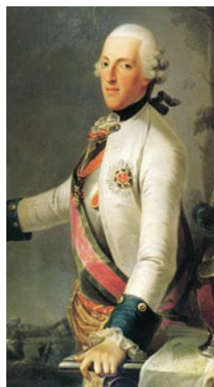
Ducele Albert de Saxa-Teschen

Anonim, Albert de Saxa-Teschen, 1777; © Albertina, Viena | Alexandre Roslin, Arhiducesa Maria Cristina, 1778; © Albertina, Viena; Împrumut permanent de la Biblioteca Națională Austriacă Viena | Georg Decker (după Anton Einsle), Arhiducele Carl de Austria, după 1847; © Albertina, Viena | Johann Nepomuk Ender, Prințesa Henrieta de Nassau-Weilburg cu fiul ei cel mare arhiducele Albrecht, nedatat; © Albertina, Viena | Georg Decker, Arhiducele Albrecht; nedatat; © Albertina, Viena | Anonim, Arhiducele Frederic; nedatat; © Albertina, Viena