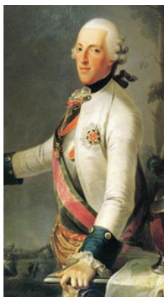
Герцог Альберт Саксонский-Тешенский

Неизвестный автор, Альберт Саксонский-Тешенский, 1777; © Альбертина, Вена | Александр Рослин, Эрцгерцогиня Мария Кристина, 1778; © Альбертина, Вена; Предоставлено в долгосрочное пользование Австрийской национальной библиотекой в Вене (Österreichische Nationalbibliothek Wien) | Георг Декер (после Антона Айнсле), Эрцгерцог Карл Австрийский, после 1847; © Альбертина, Вена | Иоганн Непомук Эндер, Принцесса Генриетта фон Нассау-Вейльбург с ее старшим сыном, эрцгерцогом Альбрехтом, б.г.; © Альбертина, Вена | Георг Декер, Эрцгерцог Альбрехт; б.г.; © Альбертина, Вена | Неизвестный автор, Эрцгерцог Фридрих; б.г.; © Альбертина, Вена