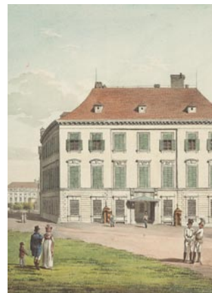
Якоб Альт, Дворец герцога Альберта Саксонского-Тешенского, 1816

Венская Альбертина является одной из самых выдающихся мировых коллекций произведений искусств. С 1805 года она размещается в одном из роскошнейших дворцов Европы в стиле классицизма. Ее название произошло от имени основателя коллекции – герцога Альберта Саксонского-Тешенского, зятя Марии Терезии. Герцог Альберт приказал расширить барочный городской дворец графа Сильва-Тарука, дополнив его в 1802-1804 гг. величественным флигелем с парадными залами, построенным бельгийским архитектором Луисом де Монтойером. Изысканные предметы интерьера залов в стиле Людовика XVI были изготовлены во французских придворных королевских мастерских Парижа и Версаля. В 1822 г. эрцгерцог Карл, приемный сын и наследник герцога Альберта, распорядился полностью изменить интерьер теперь уже габсбургских Парадных залов в стиле французского ампира и заказал Иосифу Дангаузеру ценную мебель и паркетные полы для убранства дворца. Своим величественным историческим видом фасадов 1867 года дворец обязан эрцгерцогу Альбрехту, старшему сыну Карла. В 1895-1897 гг., на последнем этапе обустройства дворца, по указу эрцгерцога Фридриха, племянника и приемного сына Альбрехта, были созданы так называемые «Испанские апартаменты» – единственная постоянная резиденция испанской королевской семьи за пределами своей страны.