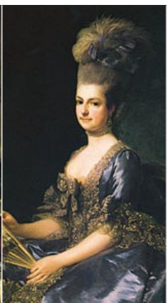
Эрцгерцогиня Мария Кристина