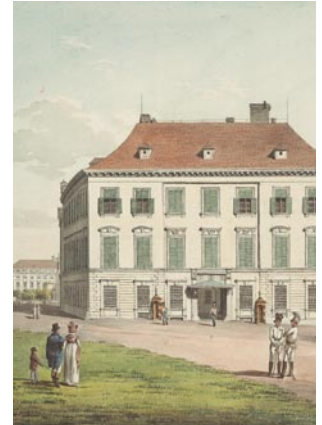
Jakob Alt, el palacio del duque Alberto de Sajonia-Teschen, 1816

El Albertina de Viena contiene las colecciones más importantes del mundo. Desde 1805 se emplazan en uno de los palacios clasicistas más suntuosos de Europa. Debe su nombre al duque Alberto de Sajonia-Teschen, iniciador de la colección y yerno de María Teresa. El duque Alberto hizo ampliar el palacio urbano barroco del conde Silva-Tarouca con una imponente ala de lujosos salones, construida por el arquitecto belga Louis de Montoyer entre 1802 y 1804. El exquisito mobiliario estilo Luis XVI procedía de los talleres reales franceses de París y Versalles. En 1822 el archiduque Carlos, hijo adoptivo y heredero del duque Alberto, inició la remodelación de los ahora Salones Reales de los Habsburgo, en estilo imperial francés, encargando a Joseph Danhauser que equipara el palacio con elegantes muebles y artísticos suelos de parquet. El aristocrático e histórico aspecto de la fachada del palacio que data de 1867, se debe al archiduque Alberto, el hijo mayor de Carlos. Entre 1895 y 1897, durante la última fase de remodelación del palacio, surgió bajo el mandato del sobrino de Alberto, e hijo adoptivo del archiduque Federico, los llamados "Aposentos Españoles", única residencia permanente de la familia real española fuera de su país.