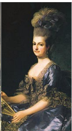
Archiduquesa María Cristina