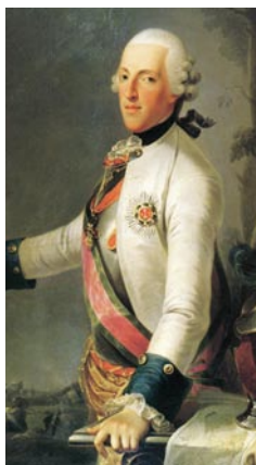
Duque Alberto de Sajonia-Teschen

Anónimo, Alberto de Sajonia-Teschen, 1777; © Albertina, Viena | Alexandre Roslin, Archiduquesa María Cristina, 1778; © Albertina, Viena; préstamo permanente de la Biblioteca Nacional Austríaca, Viena | Georg Decker (por Anton Einsle), Archiduque Carlos de Austria, después de 1847; © Albertina, Viena | Johann Nepomuk Ender, Princesa Enriqueta de Nassau-Weilburg con su hijo mayor el Archiduque Alberto, n.d.; © Albertina, Viena | Georg Decker, Archiduque Alberto; n.d.; © Albertina, Viena anónimo, Archiduque Federico; n.d.; © Albertina, Viena