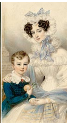
Henrietta nassau-weilburgi hercegnő