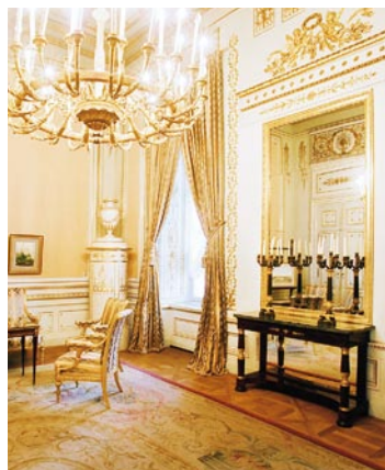
Károly főherceg hálószobája

Károly főherceg hálószobája: Bútorok: a MAK–Österreichisches Museum für angewandte Kunst/Gegenwartskunst tartós kölcsönei | Teaszalon: | Írószoba: Bútorok: a MAK–Österreichisches Museum für angewandte Kunst/Gegenwartskunst tartós kölcsönei | Múzeumterem