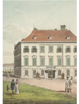
Jakob Alt: Albert szász-tescheni herceg palotája, 1816

A bécsi Albertina a világ legjelentősebb gyűjteményeinek egyike, melynek 1805 óta Európa egyik legpompásabb klasszicista stílusú kastélya ad helyet. Nevét Albert szász-tescheni hercegről kapta, aki a gyűjtemény alapítója és egyben Mária Terézia veje volt. Albert herceg Silva-Tarouca gróf barokk városi palotáját 1802 és 1804 között Louis de Montoyer belga építész tervei alapján egy impozáns szárnyal bővítette, mely a dísztermeket foglalja magába. A XVI. Lajos-stílusú különlegesen értékes berendezés a francia királyi udvar párizsi és versailles-i műhelyeiből származik. Károly főherceg, Albert herceg öröke fogadott fia és örököse, 1822-ben francia empire stílusban alakíttatta át az immáron Habsburg dísztermet, és Joseph Danhausert bízta meg azzal, hogy a palotát értékes bútorokkal rendezze be és művészi igényű parkettával lássa el. A magas uralkodói reprezentáció igényét tükröző, 1867-ből származó palotahomlokzat Albrecht, Károly legidősebb fiának nevéhez köthető. Az úgynevezett „Spanyol apartman”, mely a spanyol királyi család egyetlen állandó külföldi rezidenciájaként szolgált, Frigyes főherceg, Albrecht unokaöccse és öröke fogadott fia idején, a palota berendezésének utolsó, 1895 és 1897 közötti szakaszában készült el.