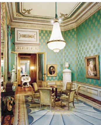
Az írószoba az aranylakosztállyal a háttérben