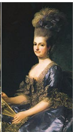
Mária Krisztina főhercegnő