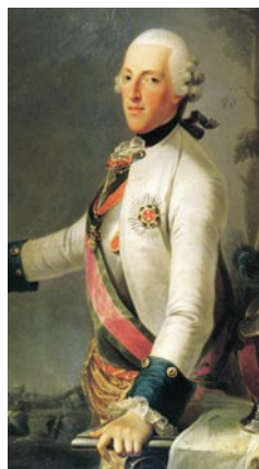
Albert szász-tescheni herceg

Ismeretlen festő, Albert von Sachsen-Teschen, 1777; © Albertina, Wien | Alexandre Roslin, Mária Krisztina főhercegnő, 1778; © Albertina, Wien; a bécsi Osztrák Nemzeti Könyvtár tartós letéje | Georg Decker (Anton Einsle nyomán), Károly osztrák főherceg, 1847 után; © Albertina, Wien | Johann Nepomuk Ender, Henrietta nassau-weilburgi hercegnő idősebb fiával, Albrecht főherceggel, évszám nélkül; © Albertina, Wien | Georg Decker, Albrecht főherceg; évszám nélkül; © Albertina, Wien | Ismeretlen festő, Frigyes főherceg; évszám nélkül; © Albertina, Wien